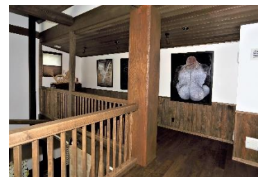
趣味の2階ギャラリー