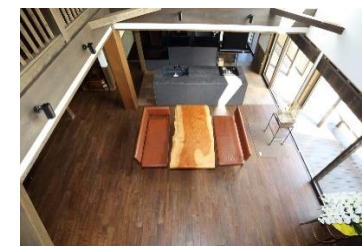
吹き抜けのリビング