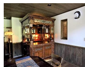
輸入家具のカウンターバー