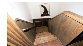
栗の木の階段と手すり