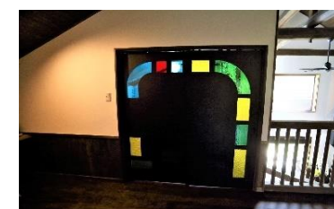
ご施主様デザインのカラーガラス引き戸