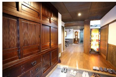
水屋タンス風の下駄箱