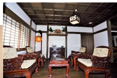
格天井のアンティーク仕上げ