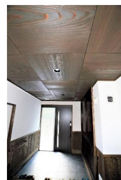
秋田杉の市松張り