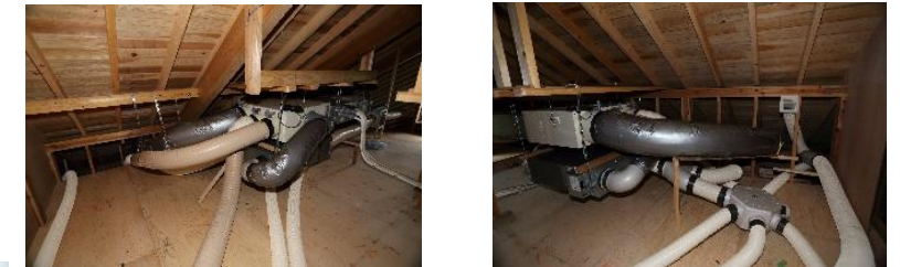
屋根裏の第一種全熱交換型換気装置とエアコン