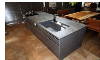
アイランドキッチン