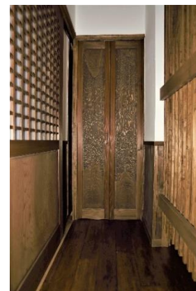
木目ドアと柵格子の引き戸